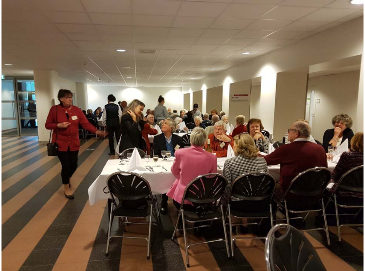
Bijna honderd (het maximale aantal) GSVU-leden genoten op dinsdag 8 januari van een heerlijke nieuwjaarslunch in de foyer van VUmc