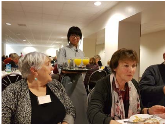
De medewerkers van de catering zorgden - als elk jaar - weer uitstekend voor ons