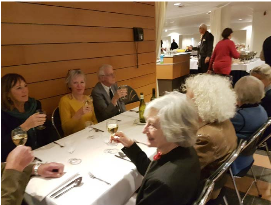
Tijdens de maaltijd konden de bijna honderd GSVU-leden weer even bijpraten