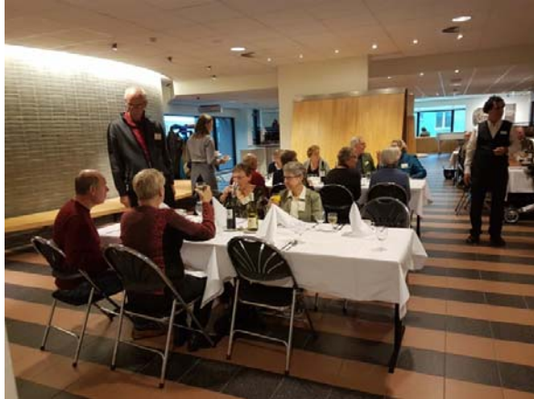
In plaats van ronde waren er dit jaar rechthoekige tafels