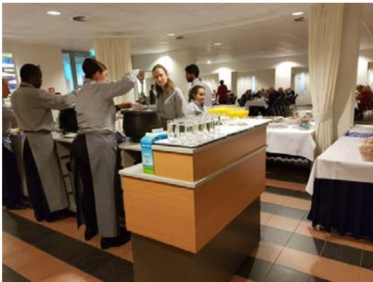
De medewerkers van VUmc zorgden voor een heerlijk lunch-buffet...