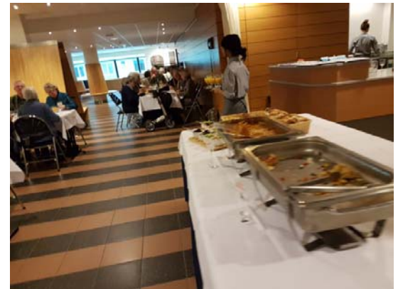
...met zowel koude als warme gerechten