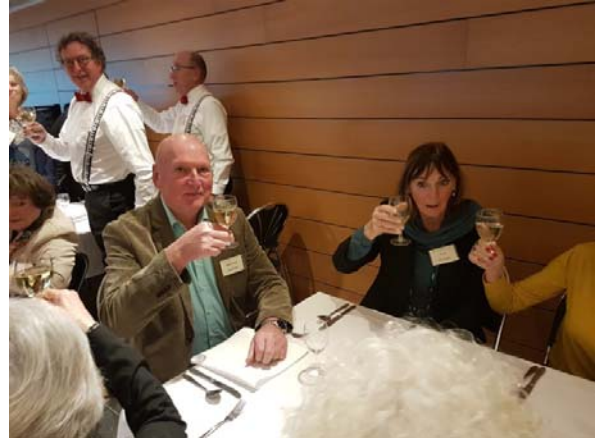
Hoewel we wat verder uit elkaar zaten was de sfeer uitstekend