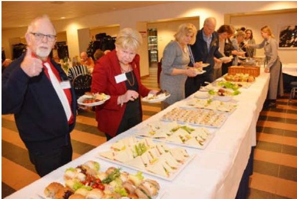
De medewerkers van VUmc zorgden voor een heerlijk lunch-buffet