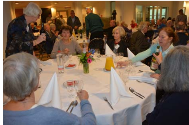
Tijdens de maaltijd konden de honderd GSVU-leden weer even bijpraten